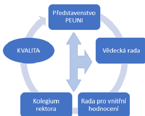
Obrázek: Orgány PEUNI zabezpečující kvalitu a její hodnocení

Na univerzitě aplikovaný Model excelence EFQM představuje soubor doporučení, jejichž aplikace ovlivňuje styl řízení a jejichž výsledkem jsou zlepšení, která se projeví jak ve vzdělávání, tak ve vztazích se studenty, zaměstnanci a ostatními subjekty. Významným rysem zvoleného modelu je uznávání různých přístupů a metod, které ponechávají prostor pro vlastní řešení a je využíván i v akademickém prostředí.