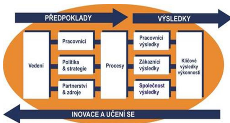
Obrázek: Oblasti hodnocení modelu EFQM

Při zajišťování kvality a vnitřního hodnocení se PEUNI zaměřuje na oblasti a kritéria definovaná Modelem excelence EFQM: